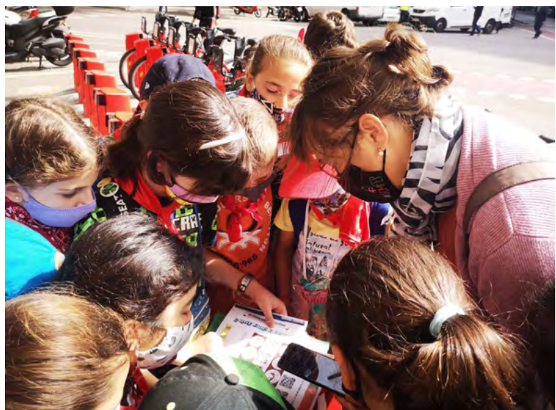
ACTIVITAT ESCOLES + SOSTENIBLES